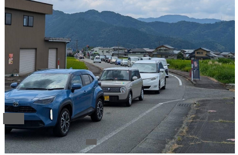
↑ 渋滞の様子(渋滞延長約3km) ・渋滞が発生すると恐竜博物館前の駐車場に駐車するまでに長いときは 90分以上 かかる ・緊急車両の通行に支障が生じる

かつやま恐竜の森では、3連休中日及びお盆期間の間、多くの来園者で混み合い、公園内の駐車場の満車や周辺道路の渋滞が予想されます。 勝山市は、渋滞緩和対策として、 公園周辺道路の交通規制(10時~16時) を行うとともに、 園内駐車場が満車 となった場合は、 公園への入場を制限 し、臨時駐車場(JAM福井勝山マウンテンリゾート)からの無料シャトルバスをご案内します。 入場制限は、園内駐車場の空き状況をみながら 9時半頃から15時 までの間で 随時実施 しますので公園入口の誘導員の指示に従ってください。